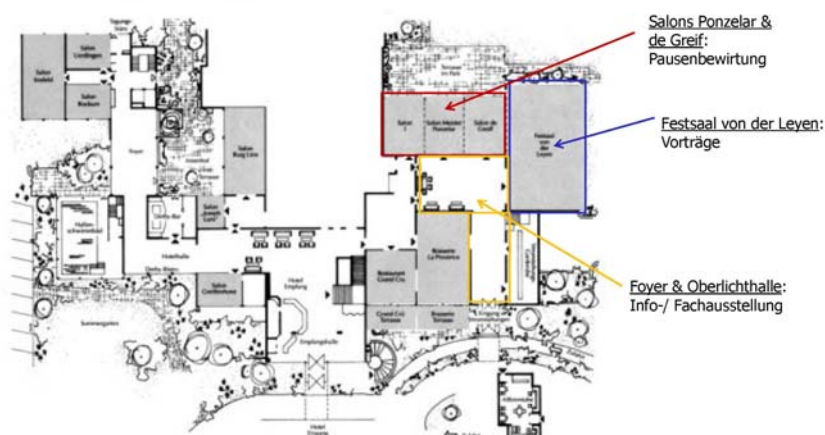
Informationsausstellung zur CastTec 2012 - Grundriss Hotel Krefelder Hof

Die Informationsausstellung wird in unmittelbarer Nähe der Vortragsveranstaltung im Foyer vor dem Vortragssaal „Festsaal von der Leyen“ mit angrenzender Oberlichthalle, wie auf der Abbildung unten dargestellt, stattfinden.